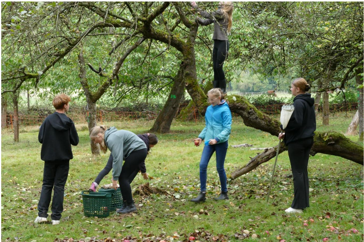
Vormittags auf der Streuobstwiese am Erntetag 2025.