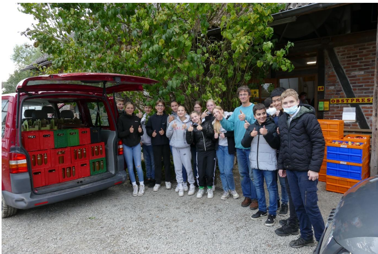
Nach einem langen Arbeitstag: Was morgens noch am Baum hing, steckt nun in Flaschen. Alle Kisten und Bags sind verstaut – Zeit für die Rückfahrt nach Uslar.