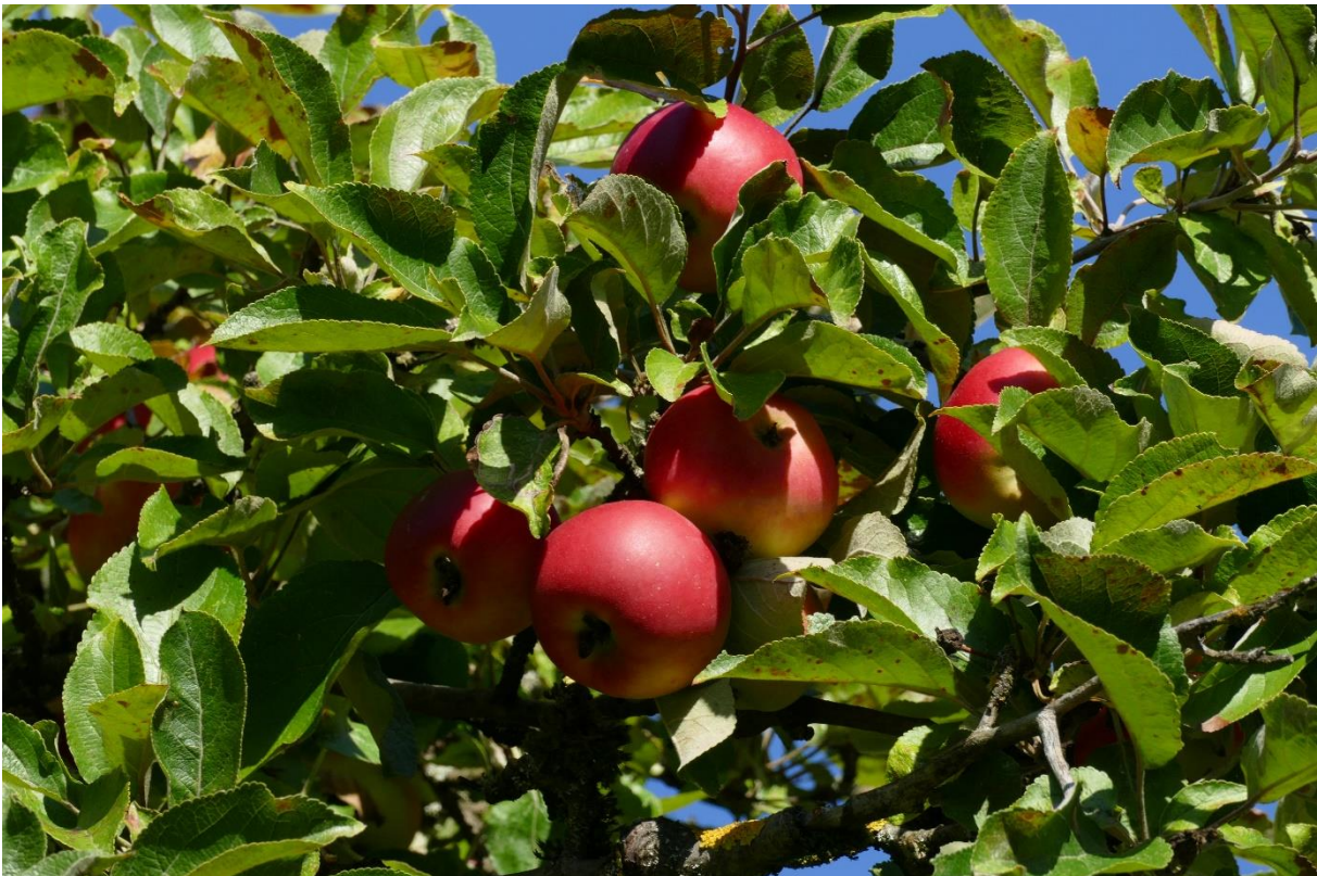
Reife Äpfel der Sorte 'Baumanns Renette'; September 2022.