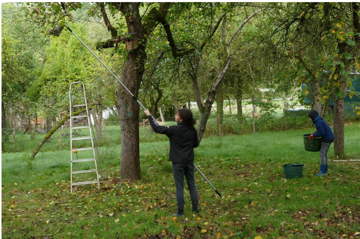
Lamis nutzt den Obstpflücker; Erntetag 2021.