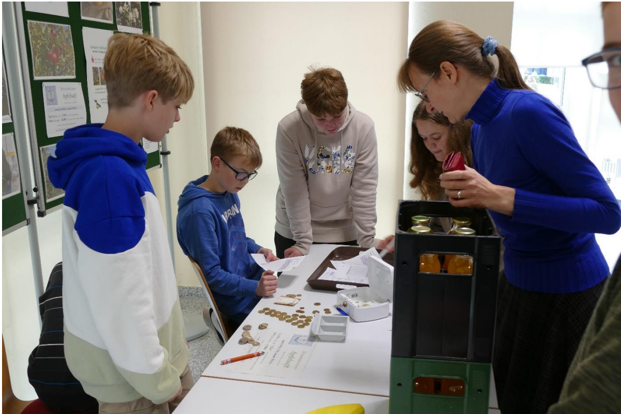
Softverkauf in der Schule: Über etwa drei Wochen betreiben die Kursteilnehmerinnen und -teilnehmer einen Verkaufsstand in der Mensa. In jeder großen Pause hat ein Team aus in der Regel drei Schülerinnen und Schülern Dienst; September/Oktober 2024.