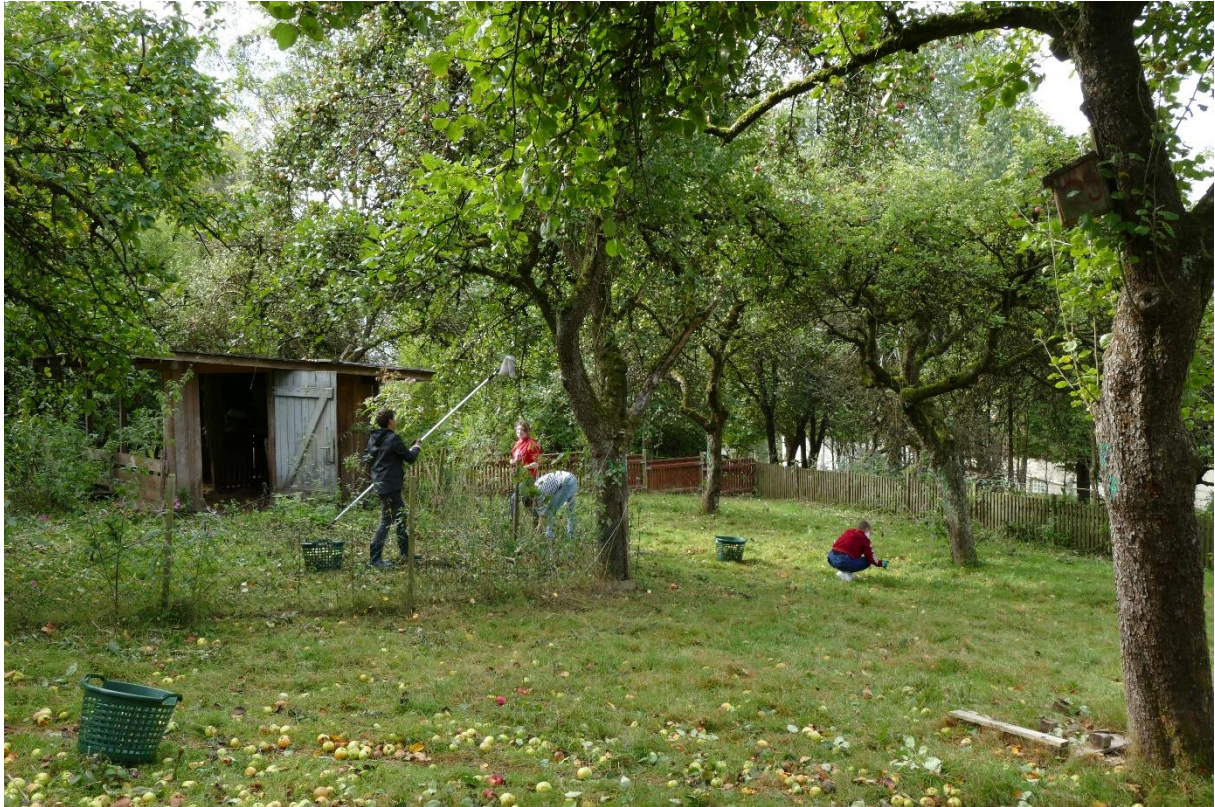
Apfelernte auf der Streuobstwiese am Vormittag des Erntetages 2020.