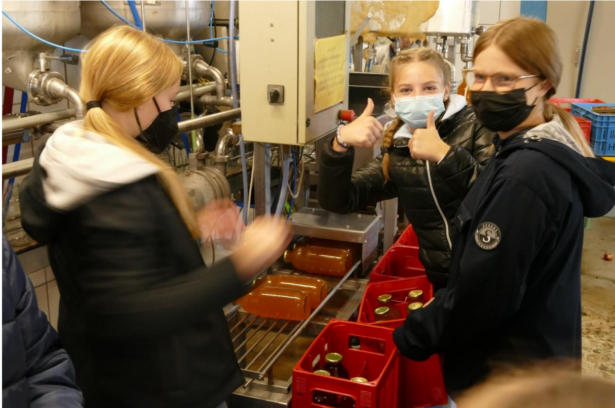
Die abgewaschenen Saftflaschen werden in 6er-Pfandkisten gestellt (Erntetag 2022)...