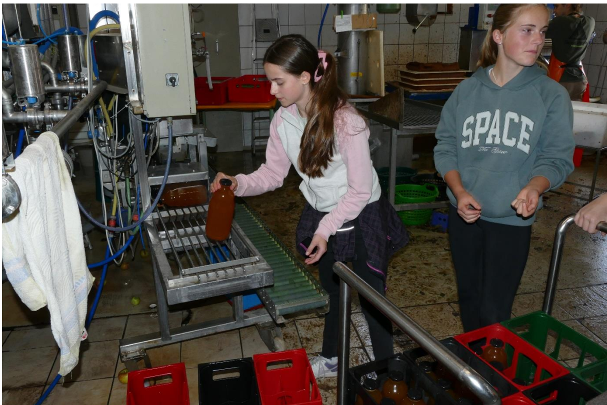
Da die Flaschen bis zum Überlaufen befüllt werden, durchlaufen die verschlossenen Flaschen anschließend ein Wasserbad; Erntetag 2025.