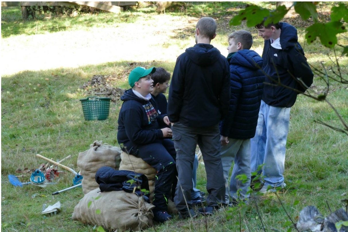
Päuschen auf der Streuobstwiese; Erntetag 2025.