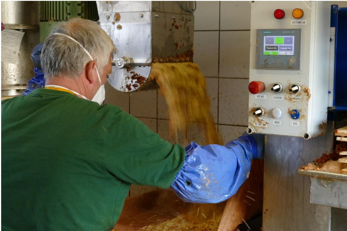
Das Häckseln der gewaschenen Früchte und das Abfüllen der Maische in die Presstücher wird grundsätzlich von Mitarbeitern der Obstpresse übernommen; Erntetag 2022.