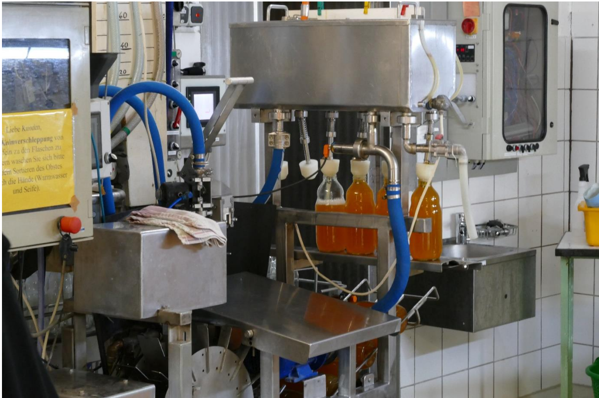
Der Rohsaft wird bei ca. 82 °C pasteurisiert und dann randvoll in 1 l-Glas-Mehrwegflaschen mit twist-off-Deckel abgefüllt; Erntetag 2021.