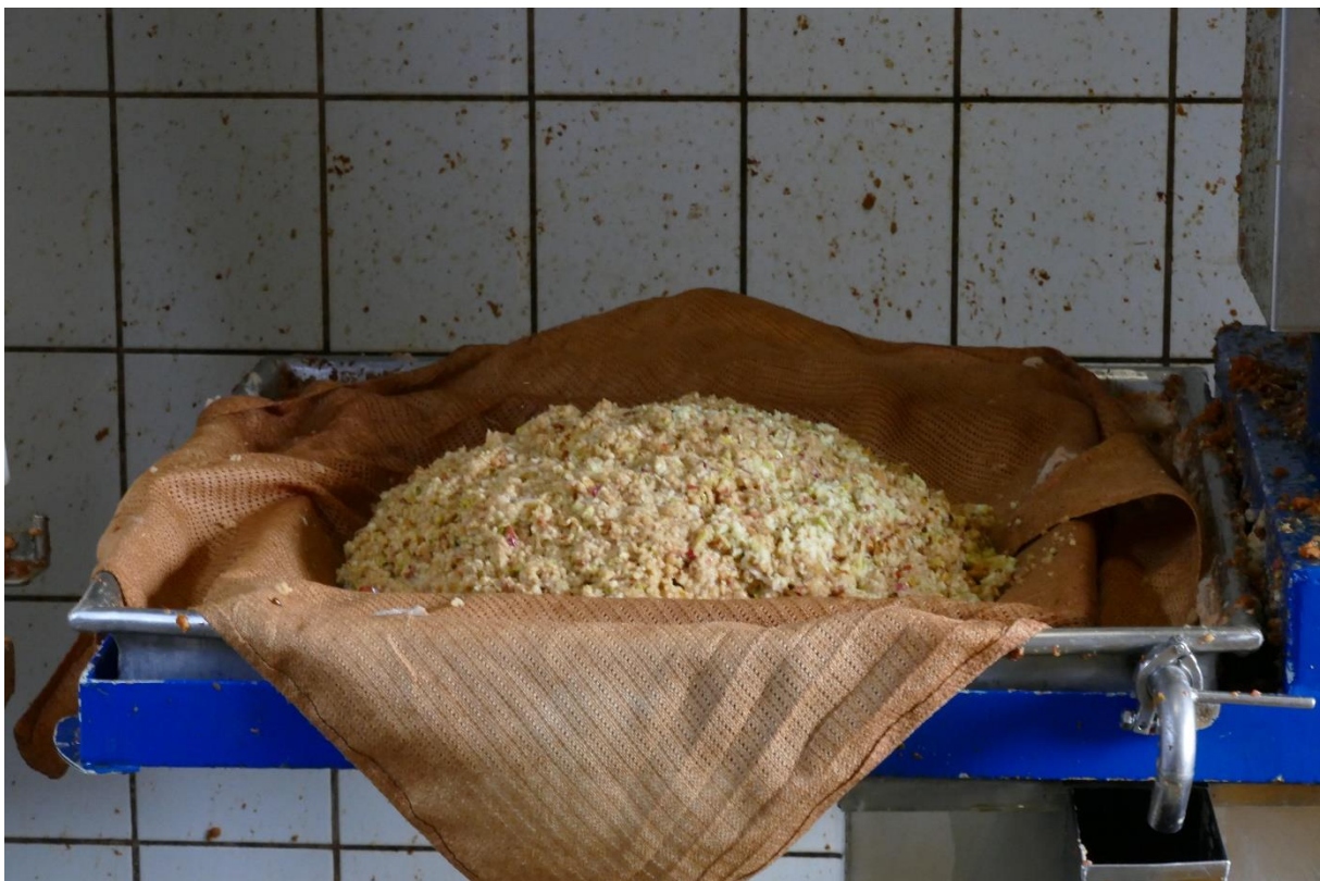
Maische im Presstuch; Erntetag 2021.