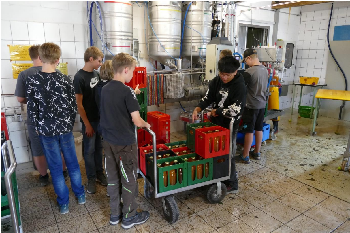
... und diese dann auf ein Rollwägelchen verfrachtet (Erntetag 2024).