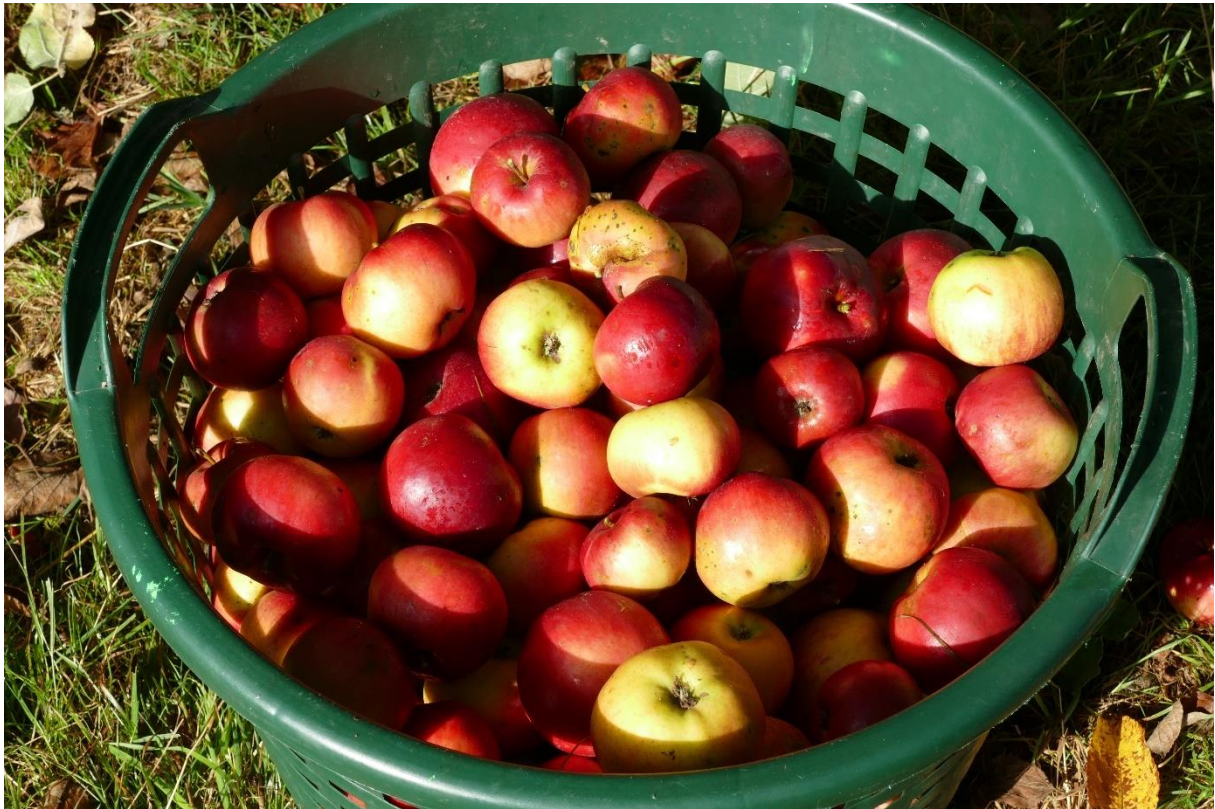
Ein voller Erntekorb, hauptsächlich 'Danziger Kantapfel'; Erntetag 2025.