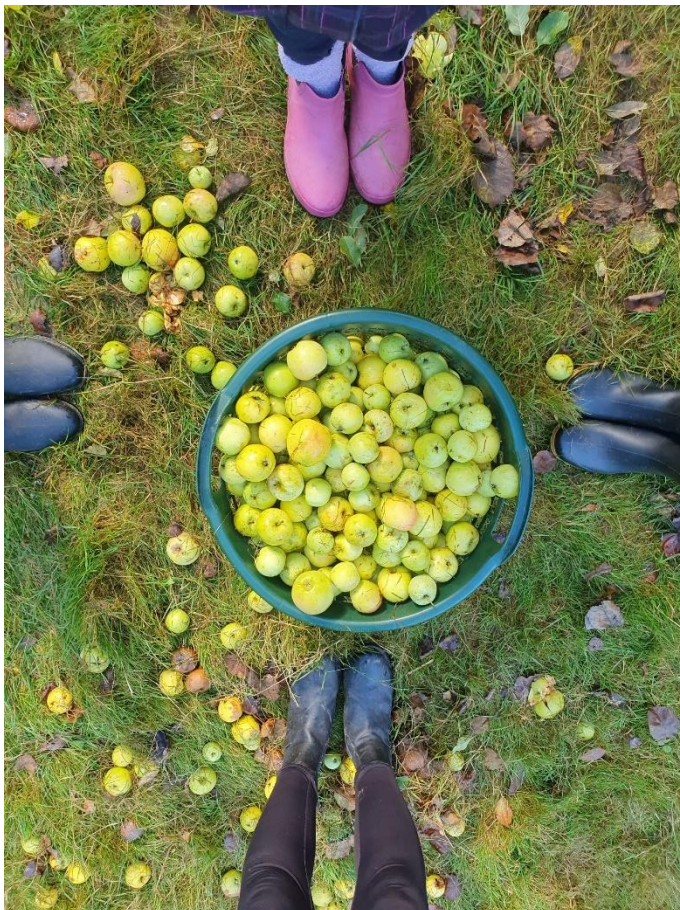
Kunstwerk mit Äpfeln; Erntetag 2025.