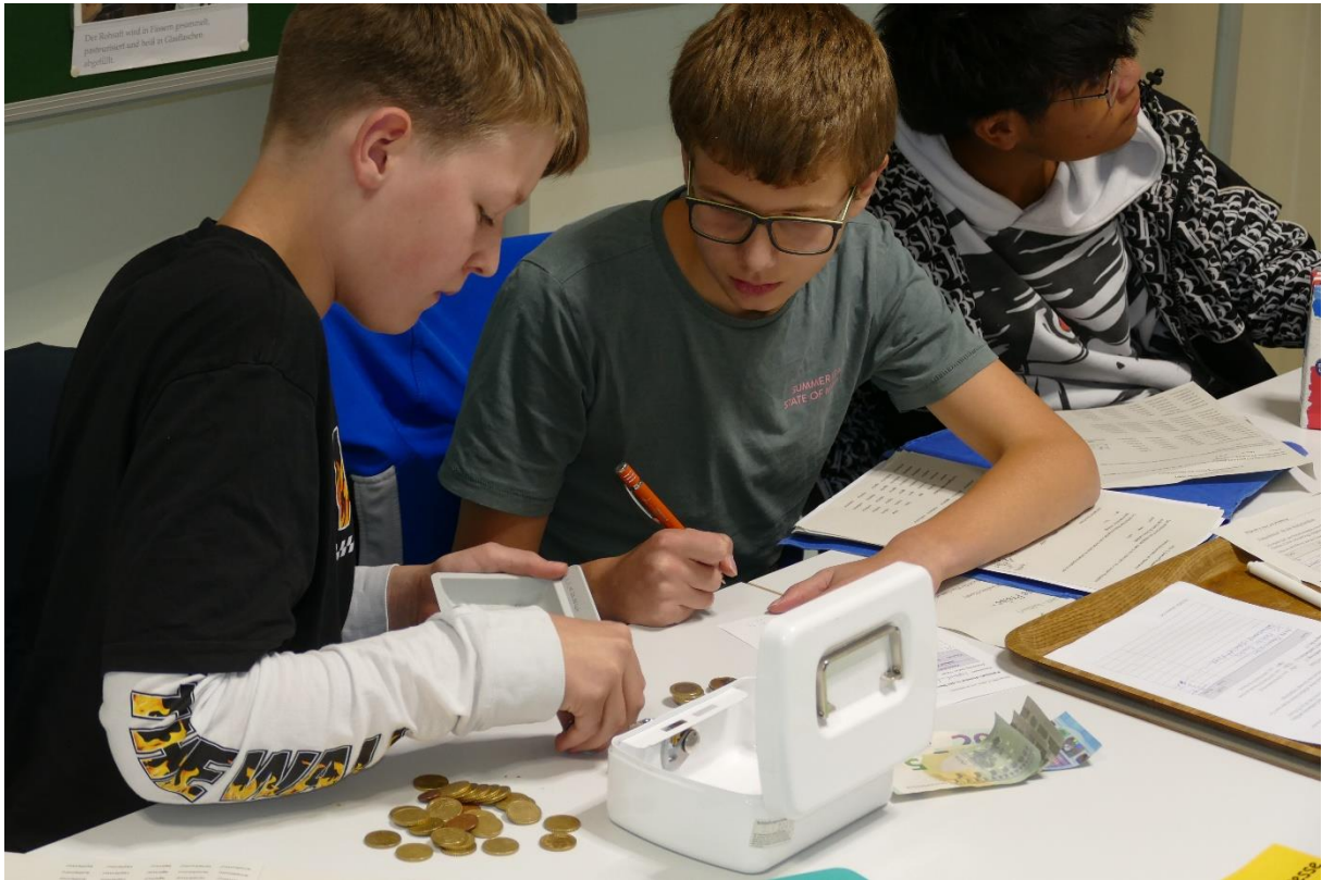
Die Kasse muss stimmen; Oktober 2024.