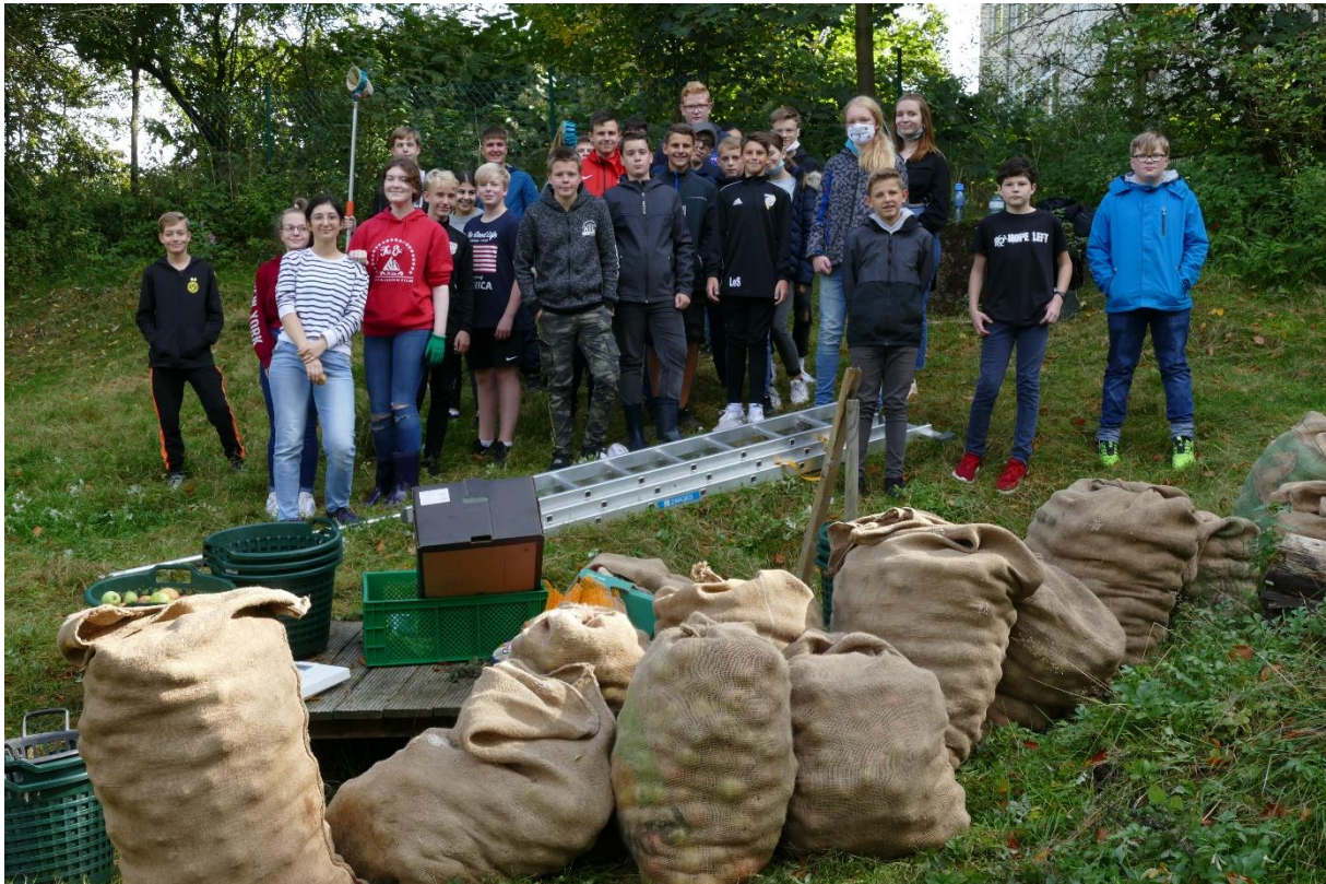
Gruppenfoto mit Ernte und Equipment am Erntetag 2020.